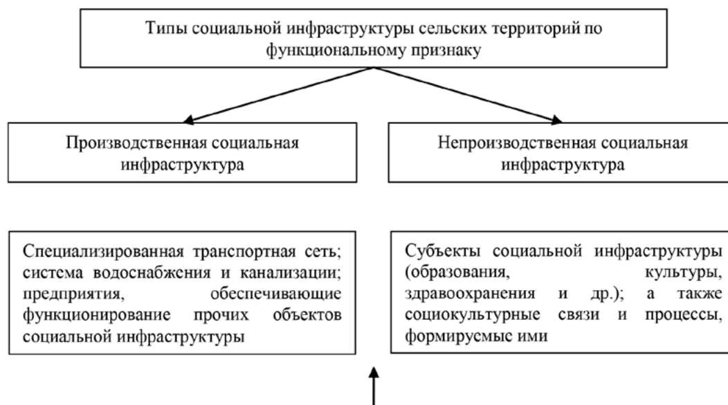
Рис. 2. Характеристика типов социальной инфраструктуры сельских территорий по функциональному признаку

По функциональному признаку типы социальной инфраструктуры сельских территорий можно разграничить на два типа (рис. 2).