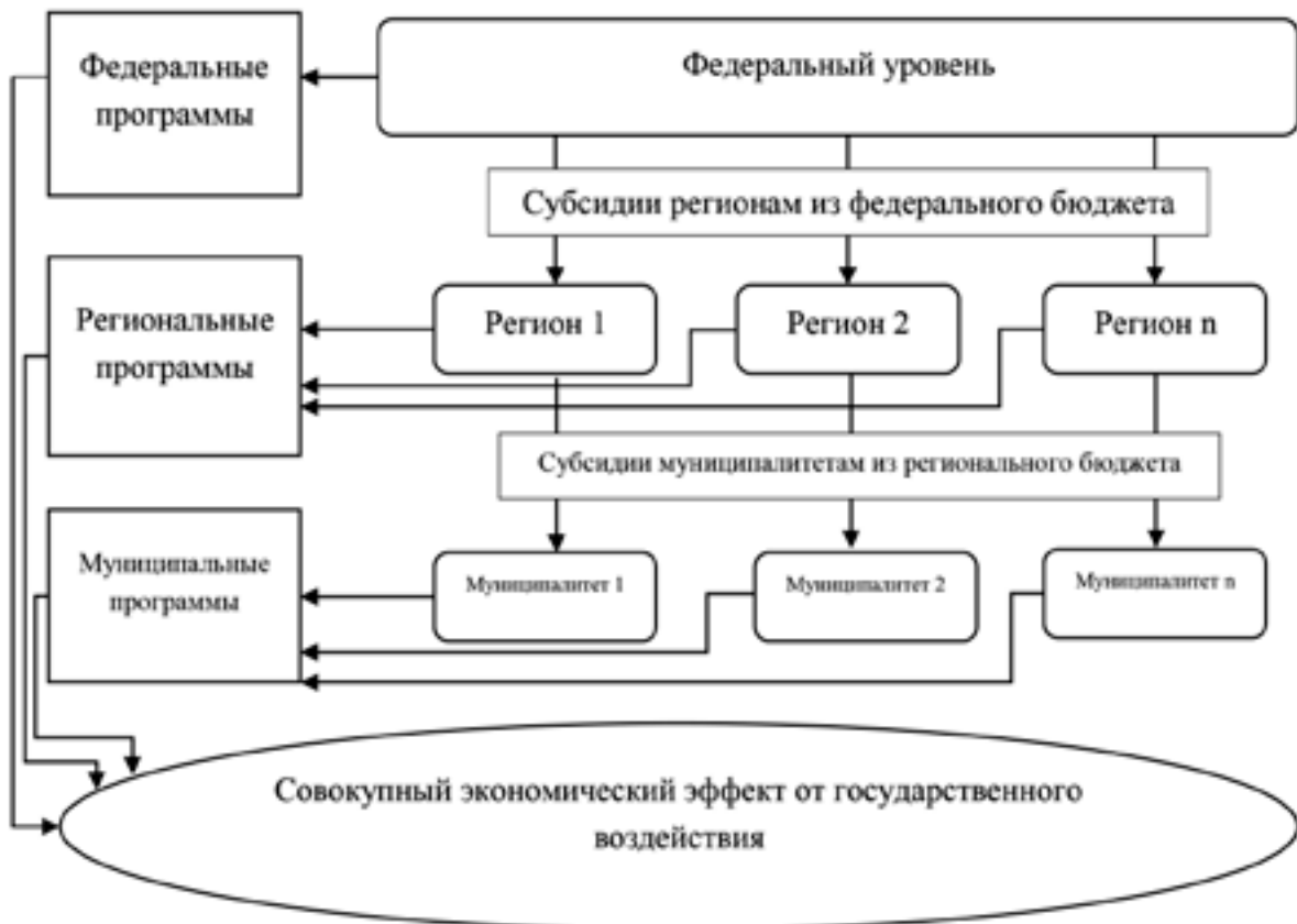
Рис. 2. Система государственного управления туристской индустрией

Все перечисленные органы в совокупности формируют систему управления туристской индустрией на территории России. Для корректной работы этой системы необходимо развитое межведомственное взаимодействие как по вертикали (между разными уровнями власти), так и по горизонтали (взаимодействие между функциональными органами, находящимися на одном уровне) (рис. 2).