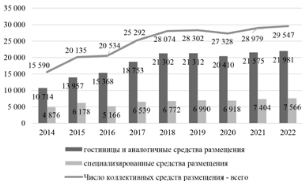
Рис. 5. Количество средств размещения в России в 2014-2022 гг. (ед.) [8]