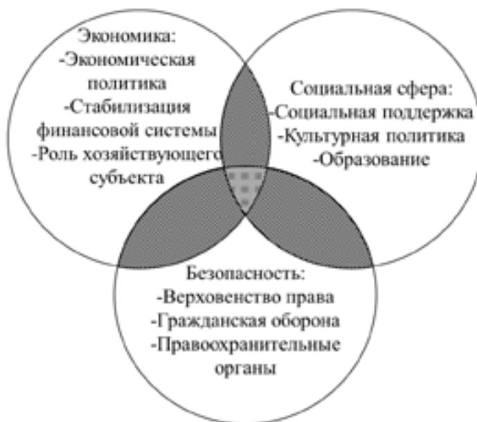
Рис. 1. Схематичное представление основных функций государства

Государственное регулирование направлено главным образом на исполнение основных функций государства (рис. 1). Среди основных таких функций следует выделить экономическую, социальную и обеспечение безопасности. Среди обозначенного списка не указаны многие прочие функции, например, культурная, идеологическая, оборонительная, обеспечение верховенства права и т.д. Связано это с тем, что, по мнению автора, все минорные функции можно рассматривать как подфункции, включённые в основные три. Помимо этого, многие из минорных функций могут отвечать требованию нескольких основных функций, например, исполнение функции образования, с одной стороны, обеспечивает граждан профессией, что снижает социальное напряжение, а с другой – обеспечивает необходимое количество кадров для отраслей народного хозяйства.