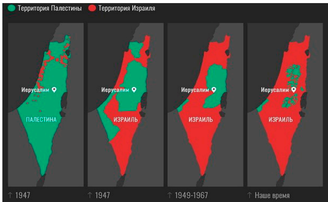
Рис. 1. Территории Палестины и Израиля [6]