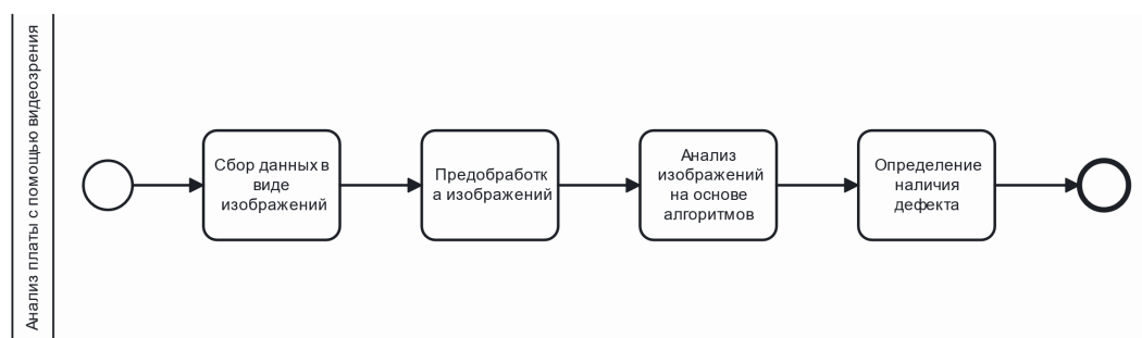
Рис. 3. Анализ платы с помощью компьютерного зрения

На рисунке 3 описан процесс анализа платы с помощью компьютерного зрения.