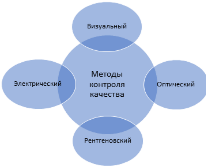
Рис. 1. Методы контроля качества на предприятиях электронной промышленности