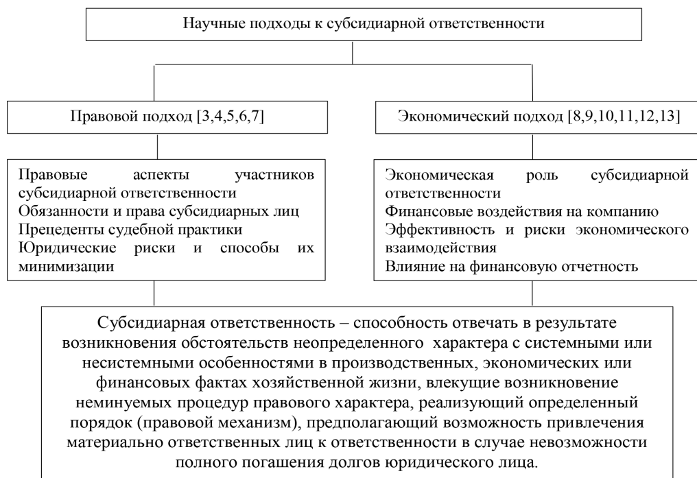
Рис. 1. Концепт содержания субсидиарной ответственности правовой и экономической подход (составлено авторами)

На рисунке 1 представлен авторский концепт систематизации и обобщения разных научных и практических подходов к наполнению субсидиарной ответственности.