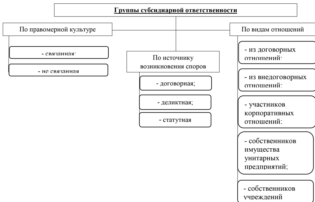
Рис. 2. Компильция признаков классификационных групп субсидиарной ответственности